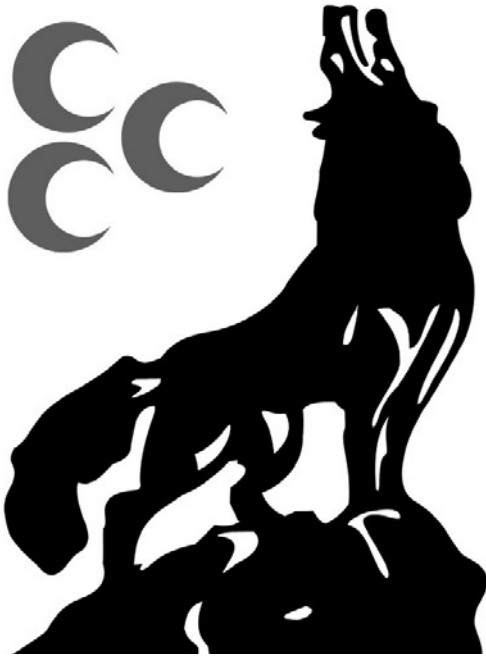
Symbole der „Grauen Wölfe“

und der Anschlag 1981 auf Papst Johannes Paul 2. wird ihnen zugerechnet. Nach dem Verbot der MHP und den Grauen Wölfen machten viele Mitglieder im Militär und in anderen staatlichen Einrichtungen Karriere. Ihre nationalistischen Bestrebungen und Verstrickungen mit der türkischen Regierung und der Mafia kommen allerdings erst 1996 nach einem skandalösen Autounfall ans Licht